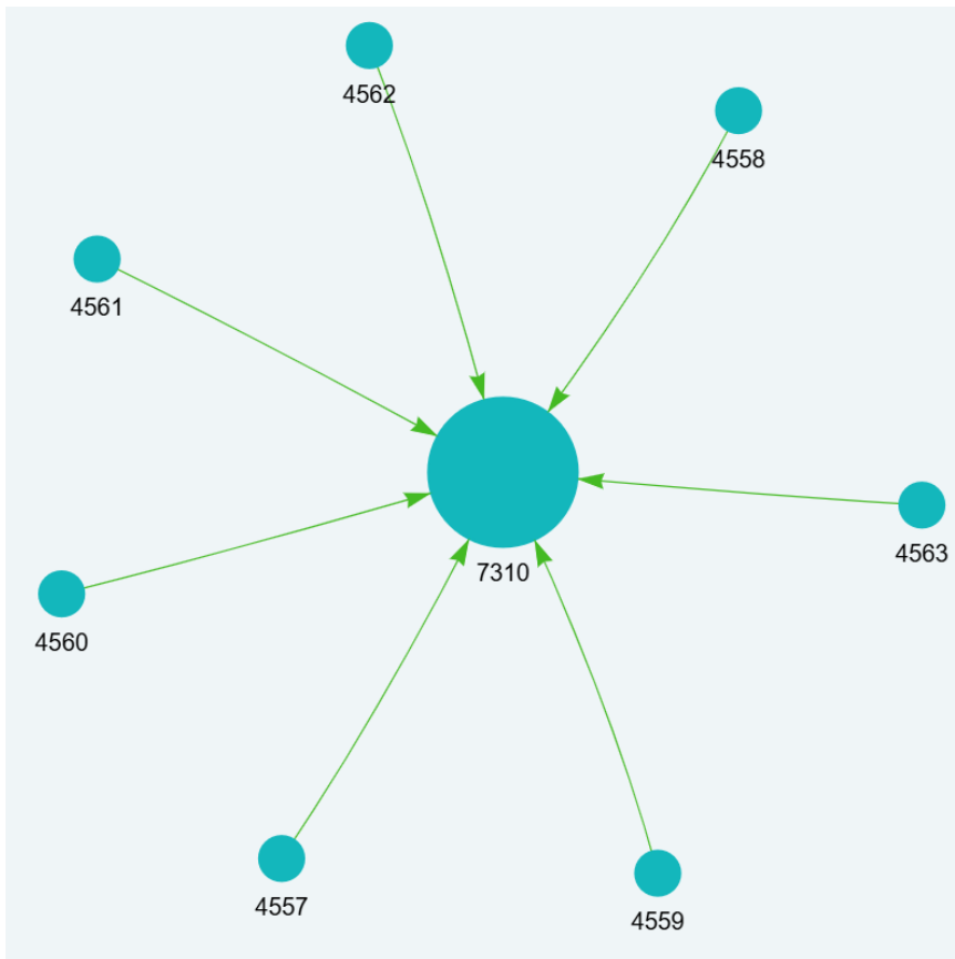
Abbildung 1: Kompetenzmodell zum Projekt Geoinformatik im Schulunterricht

Des Kompetenzmodell zum Projekt „Geoinformatik im Schulunterricht“ zeigt ein sehr klares Bild, wenn es um zentrale Kompetenzen in diesem Projekt geht. Es werden 8 Kompetenzen definiert und 7 davon hängen von der Kompetenz (7310) ab. Dabei geht es um eine Kompetenz, die auf eine relativ allgemeine Mitgestaltung von Projekten abzielt. Damit ist klar, warum gerade diese Kompetenz zentral gehandhabt wird. Interessant dabei ist allerdings, dass es keine weiteren Abhängigkeiten unter des restlichen 7 Kompetenzen gibt. Dies liegt daran, dass hier Kompetenzen zu einzelnen Aktivitäten des Projektverlaufs definiert wurden. So finden sich Kompetenzen zur Organisation von Projekten oder einer Ausstellung genauso wie zu der Erstellung von WebAR Codes oder der Nutzung einer Kartographierungssoftware. Dazu kommen auch Kompetenzen zum Wissen über Biodiversität und Geschichte im Projektgebiet. Es ist also zu sehen, warum es hier keinen längeren Lernpfad zu finden gibt.